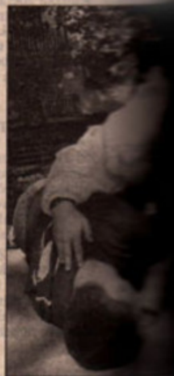
Soutěžící hlídky v situaci a ošetřují zraněného.

Výkony soutěžících hodnotili lékaři a zdravotní sestry. V kategorii 3. až 5. tříd si nejlépe vedli žáci ZŠ Vysoké Veselí, druhá skončila hlídka A ZŠ Cerekvice a třetí hlídka B stejné školy. Mezi staršími byli nejúspěšnější soutěžící ze Základní školy Chomutice (ložští vítězové), druhé místo obsadila ZŠ Daliborka Hořice, třetí příčka patří ZŠ Stará Paka. Vítězové postoupí do krajského kola, které se uskuteční 29. května v Chrudimi. iva