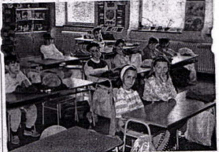
Cerekvičtí prvňáčci mají svou třídu v druhé budově školy, která je přímo propojená se školní jídelnou.

svůj názor na primární protidrogovou prevenci. Za úplně zbytečné považují množství přednášek, triček a jiných propagačních materiálů. Investovat by se mělo naopak do budování hřišť a dalších činností. Dnes s dětmi pracuje málokdo a po skončení vyučování si jich nikdo nevšímá, nemají kam jít a mnohdy skončí u drog. Je jim potřeba