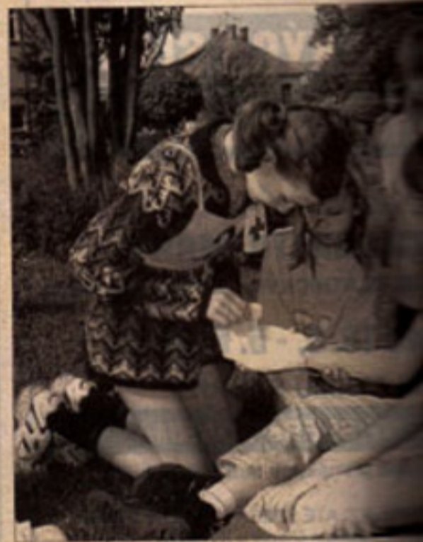
Okresního kola soutěže hlídek mladých zdravotníků družstvo z Cerekvice, ošetření poskytl Zdravotní středisko

Na dalších místech skončily v první kategorii hlídky ZŠ Ce- rekvice a Chodovice, ve druhé kategorií Gymnázium Hořice a ZŠ Chomutice. (iva)