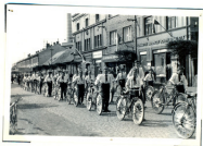
Průd žáků - kolařů.