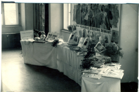
Výstava školy k 41. výročí VŘSR