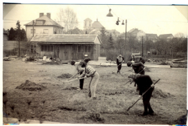
Zimní sporty upravu hřiště.

Ukázalo se, že vesnická mládež, má-li dostatek příležitosti k cvičení (trainingu), může dosáhnout ve sportu velmi pěkných výsledků, jak dokumentuje to, že hokejové žákorské družstvo církevní školy se probojovalo až do finále krajského přeboru žáků v ledním hokeji a teprve po tuhém boji na zimním stadionu v Hradci Králové podlehlo družstvu Spartaku Hradec 3:1 (1-1, 0-0, 1-0). Úspěch mladých sportovců, který komentovala i Poštovní poštovní, Mladý hokejový mládež, našel kladnou odezvu a evakuační výjimečnosti.