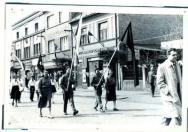
Čelo průvodu školy -

Oslava 1. máje v obecním městě se účastnilo všichni žáci školy. Kús 100 žáků jelo na vado- bených jízdních kolách, ostatní v krajích PD a ČSM. Celková vystoupení školy bylo velmi kladně hodno- ceno.