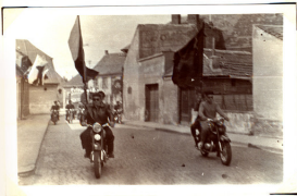
Čelo pionýrského průvodu při osvetním sktu pionýrů v Křižovicích.

18. června navštívila SpJ Boháňka-Sedla počtná delegace Slováků ze spřáteleného osvetu Krupina na Slovensku. Delegace Slováků byla velmi přátelsky přijata. Slavnostní fanfáry při příjezdu delegace zahrabali naši pionýři.