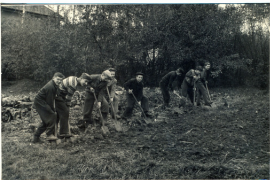
Čelák z prava se školní posvícením