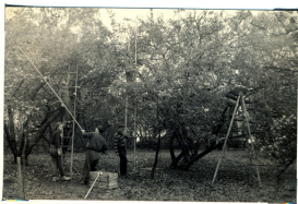
Skládání dřeva ve školní škole